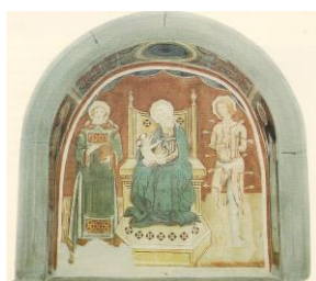
4. Madonna con Bambino tra santi (San Carlo)