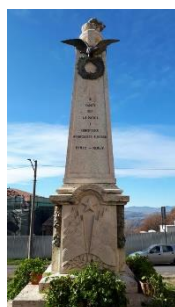
12. Monumento ai caduti