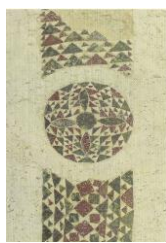
8. Facciata occid.part. San Giovanni B..