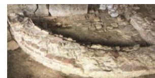
15. Struttura muraria B Terme di Carsulae

Si stanno altresì concludendo i lavori della facciata di San Francesco, compreso il dipinto murale posto nella nicchia