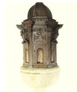
5. Portale lapideo San Francesco