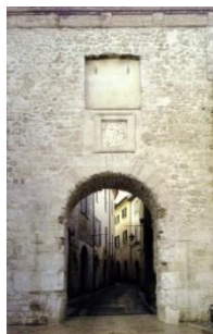
13. Porta Burgi Piazza San Francesco