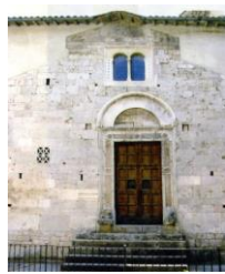
7. Portale cosmatesco San Giovanni Battista