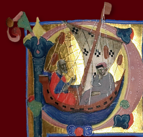
Milano, Biblioteca Trivulziana, ms. Trivulziano 1080, c. 36r.

Il Trittico dell'Ingegno Italiano 2019 - 2021