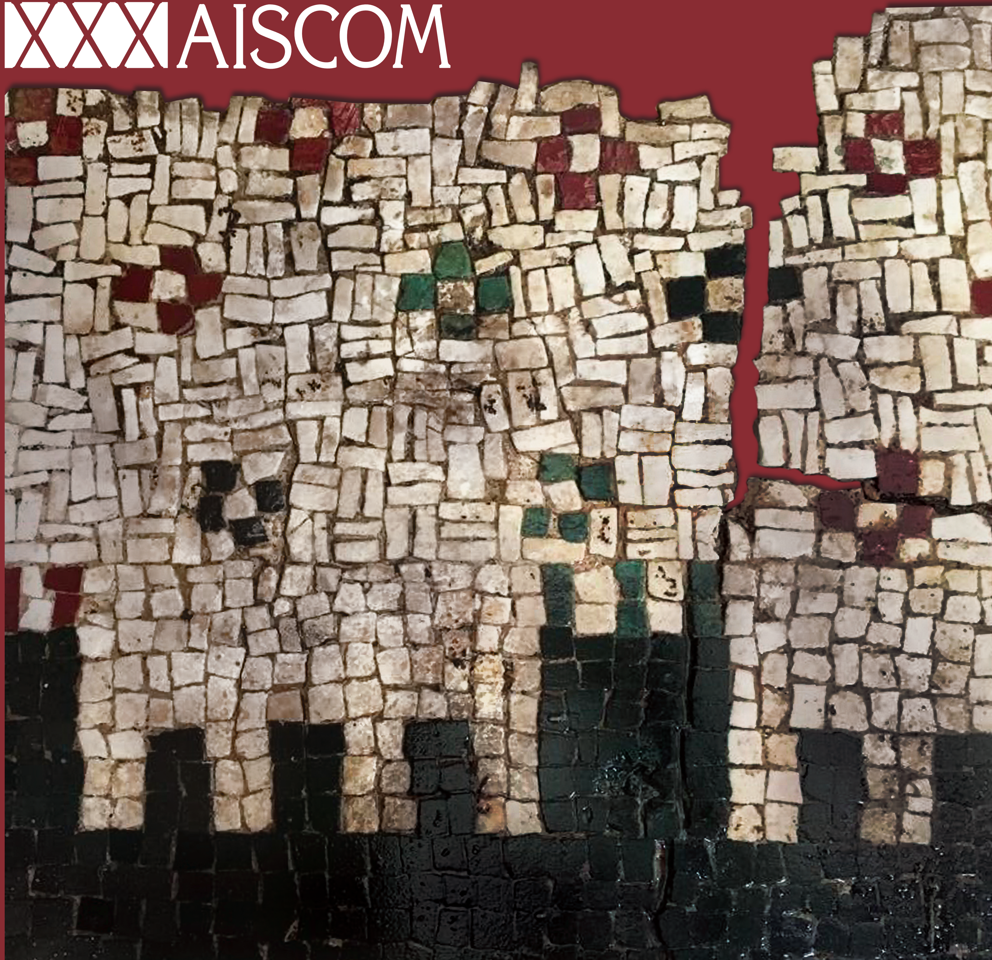
Venafro (IS), casa di via Carmine, 2. Lacerato maggiore del mosaico "a stuola", dettaglio